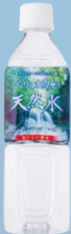
ミネラル成分比較結果 100mLあたり

くりこまの天然水はミネラルを豊富に含んでおり、体内で酵素を活性・促進 させ細胞レベルから美肌を作ります。また、水のクラスターが小さく美容成 分が肌へしっかり浸透し、肌の内側から潤いを与えます。